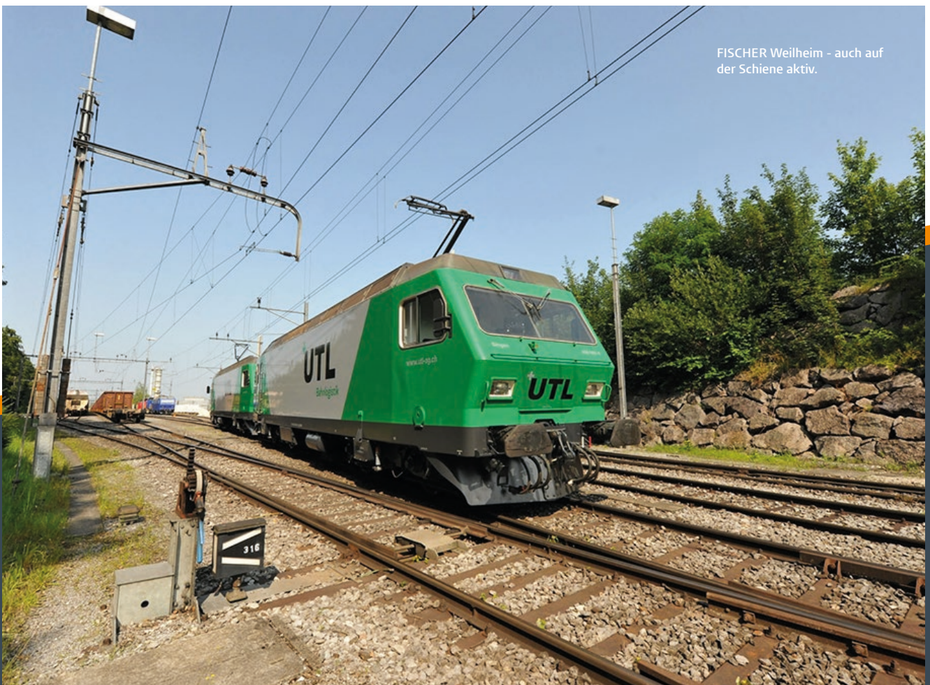
FISCHER Weilheim - auch auf der Schiene aktiv.

Landeshauptstadt und nördlich des Bodensees. Damit können wir die Containerlogistik der Nord-, Süd- und Westhäfen europaweit verbinden und CO 2 reduzieren.