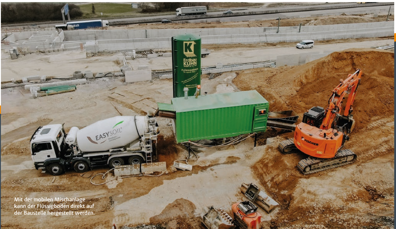
Mit der mobilen Mischanlage kann der Flüssigboden direkt auf der Baustelle hergestellt werden.

Mit unseren eigenen, zertifizierten, zeitweise fließfähigen Verfüllbaustoff EASYSOIL® Flüssigboden , lässt sich Primärrohstoff, wie Naturschotter, einsparen. Dadurch wird eine schnelle Arbeitsraumverfüllung mit dem anfallenden Bodenmaterial auf der Baustelle ermöglicht. Für die Umwelt ergibt sich daraus ein echter Mehrwert, so kann der Stoffkreislauf durch die vor Ort aufbereiteten und erneut eingebauten Böden noch auf der Baustelle geschlossen werden. Das schont wertvolle Primärressourcen und spart CO 2 ein, da Ab- und Beifuhr von Material reduziert wird. Alle detaillierten Informationen gibt's unter: www.easysoil.de .